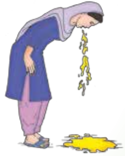
متلی اور قے آنا