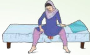
خون جاری ہونا