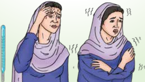
کپکپی/ سردی لگنا/ بخار ہونا