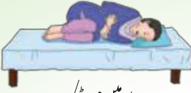
پیٹ میں مروڑ/ درد

مازوپروسٹول رحم کو سیٹھرتی ہے۔ تولیدی راستے (وجائنا) سے کچھ خون آئے گا اور پیٹ میں مروڑ/ درد ہوگا۔ کچھ خون کے جھے ہوئے ٹکڑے بھی خارج ہو سکتے ہیں۔