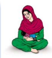
صرف ماں کا دودھ پلانے کے ذریعے وقتے