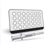
ایک ہارمون والی گولیاں اور نیپلے