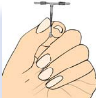
آئی یو سی ڈی